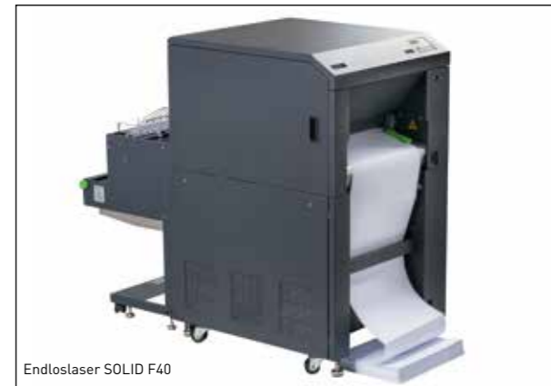
Endloslaser SOLID F40