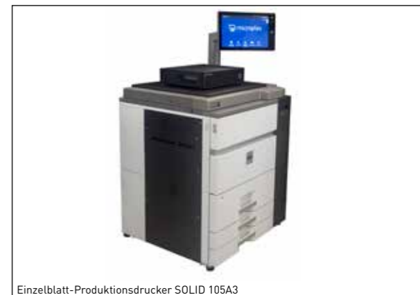
Einzelblatt-Produktionsdrucker SOLID 105A3

Beispiele für Microplex-Produkte für den Ersatz in SAP-Druckumgebungen.