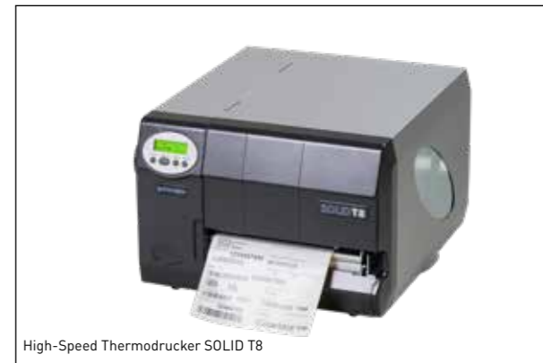
High-Speed Thermodrucker SOLID T8