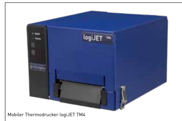
Mobiler Thermodrucker logiJET TM4