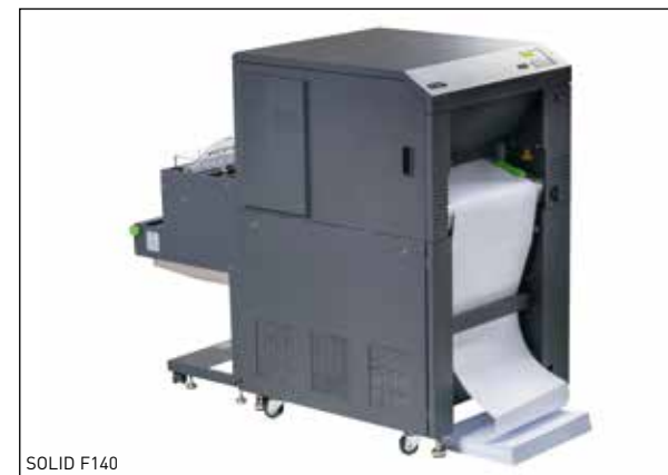
Microplex-Produkte für den Ersatz in IPDS-Druckumgebungen.