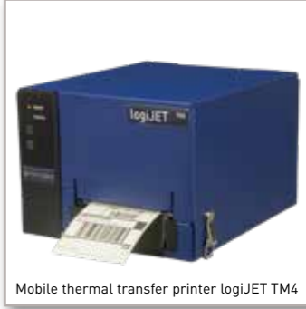
Mobile thermal transfer printer logiJET TM4